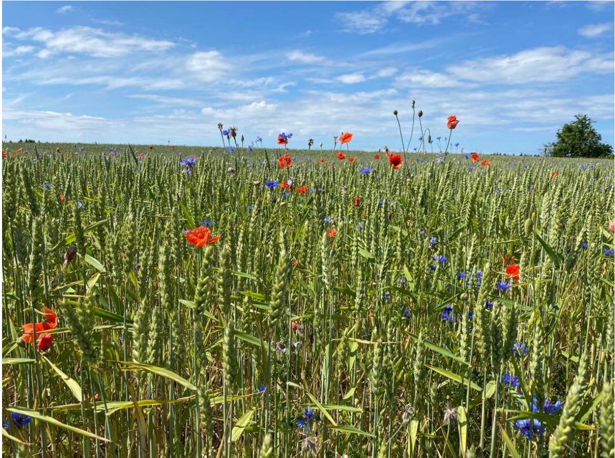
Joonis 1. Viljapõld Saaremaal (Hoole, 2021)

Diagrammid tehakse tasapinnalised. Diagrammidel olev tekst ja arvud vormindatakse Times New Roman kirjas suurusega 11 või 12 punkti, aga kõigil diagrammidel ühtemoodi. Diagrammi telgedele, millel on arvandmed, tuleb lisada telje nimed, välja arvatud juhul, kui teljel on kuupäevad või aastad ning sellest arusaamiseks vajalik info on joonise allkirjas. Diagrammile pealkirja (tiitlit) ei lisata, diagrammi alla tehakse joonise allkiri. (vt Joonis 2)