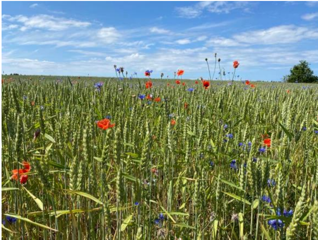
Joonis 1. Viljapõld Saaremaal (Hoole, 2021)

Diagrammid tehakse tasapinnalised. Diagrammidel olev tekst ja arvud vormindatakse Times New Roman kirjas suurusega 11 või 12 punkti, aga kõigil diagrammidel ühtemoodi. Diagrammi telgedele, millel on arvandmed, tuleb lisada telje nimed, välja arvatud juhul, kui teljel on kuupäevad või aastad ning sellest arusaamiseks vajalik info on joonise allkirjas. Diagrammile pealkirja (tiitlit) ei lisata, diagrammi alla tehakse joonise allkiri. (vt Joonis 2)